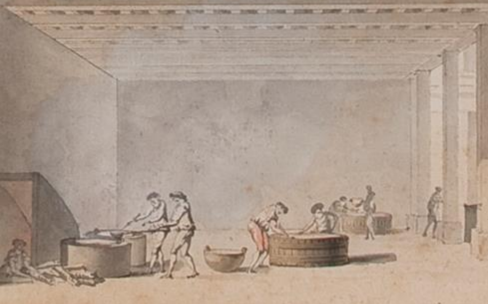
G. Moette, Représentation en coupe des huit étages de la Manufacture de papiers peints de Arthur et Grenard (détail), vers 1780, les Arts Décoratifs, inv. 37360