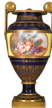
fig. 9 Vase du salon des dames d'honneur de l'appartement de l'Impératrice à Compiègne, 1806 Manufacture de Sèvres Porcelaine tendre (en partie) H. 107 ; L. 50,5 ; D. 33 cm Compiègne, musée national du château inv. C85C (1894)