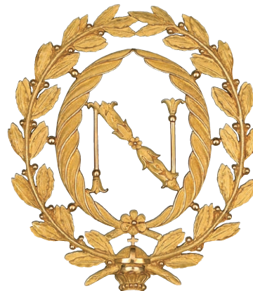
fig. 1 Collier de la Légion d'honneur du maréchal Alexandre Berthier (détail) Martin-Guillaume Biennais, vers 1807 Or, émail L. 114,5 cm Paris, musée national de la Légion d'honneur et des Ordres de chevalerie inv. 08161

LES ARTS DÉCORATIFS 107, rue de Rivoli – 75001 Paris tél. : 01 44 55 57 50 www.lesartsdecoratifs.fr