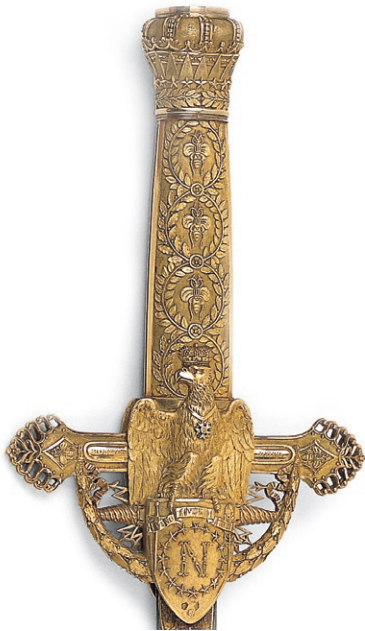
fig. 4 Glaive de Napoléon (détail), 1806 Martin-Guillaume Biennais, Or, émail, acier, écaille, L. 92 ; l. 11 cm Dépôt du musée du Louvre Fontainebleau, musée national du château