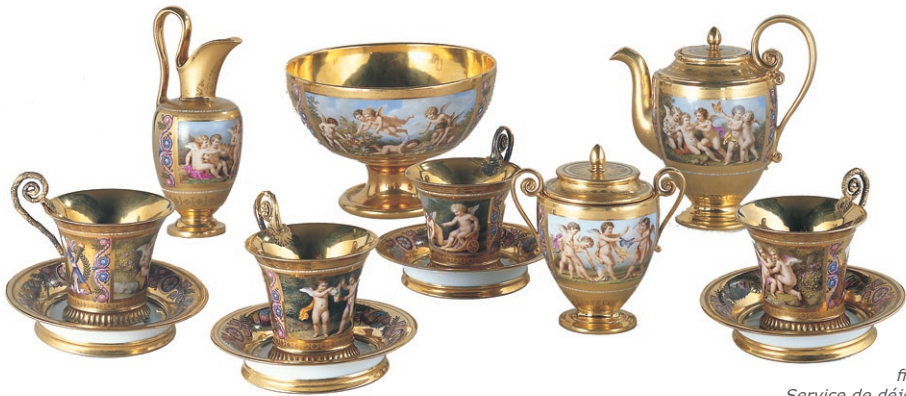
fig. 12 Service de déjeuner "Les Peines et les Plaisirs de l'Amour" 1809-1812 Manufacture de Sèvres Porcelaine dure, vermeil Tasse : H. 11,5 cm Soucoupe : H. 9 ; D. 16 cm Bol : H. 14,5 ; D. 21,7 cm Pot à lait : H. 21,8 ; L. 9,5 cm Fontainebleau, musée national du château inv. F.1985.11-12, F.1985.I.4, F.1985.I.5