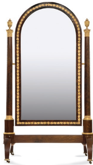
fig. 3 Psyché, vers 1814, Paris, Buteux Acajou, bronzé doré, glace H. 180 ; L. 95 cm Paris, musée des Arts décoratifs inv. 20861