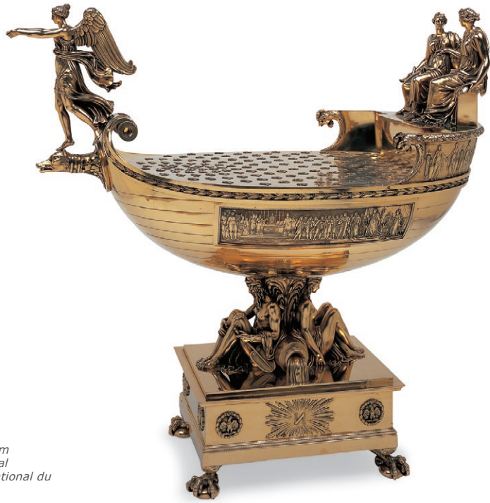
fig. 11 Nef de l'Empereur, 1804, Henry Auguste, Vermeil, H. 68 ; L. 72 ; pr. 34,5 cm Dépôt du Mobilier national Fontainebleau, musée national du château