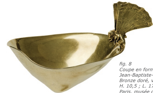
fig. 8 Coupe en forme de sein, vers 1810 Jean-Baptiste-Claude Odiot Bronze doré, vermeil H. 10,5 ; L. 17 ; D. 13 cm Paris, musée des Arts décoratifs inv. 29983