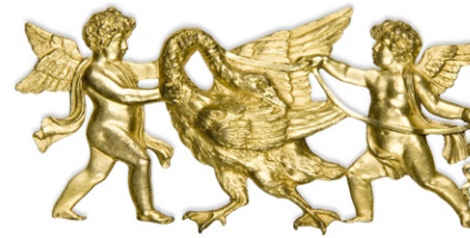
fig. 6 Applique de meuble Bronze doré H. 6,1 ; L. 12,5 cm Paris, musée des Arts décoratifs inv. 16217