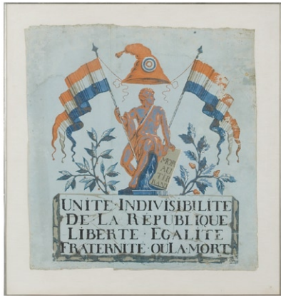
fig. 2 Papier peint révolutionnaire, 1790-1795, Manufacture parisienne H. 60 ; l. 56 cm Paris, musée des Arts décoratifs inv. 25941