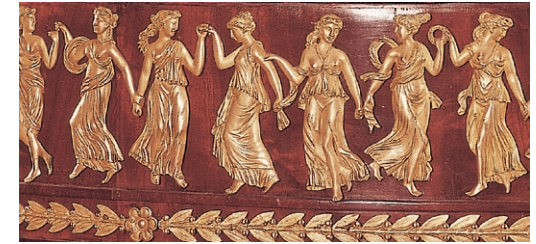
fig. 7 Table à thé (détail), vers 1805-1806 Acajou, bronze doré, marbre blanc veiné H. 84 ; D. 97 cm Versailles, Grand Trianon inv. T 252 c