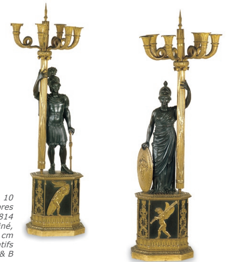
fig. 10 Paire de candélabres " Mars " et " Minerve ", 1804-1814 Bronze doré, bronze patiné, H. 101 ; l. 25 ; pr. 19 cm Paris, musée des Arts décoratifs inv. 27446 A & B