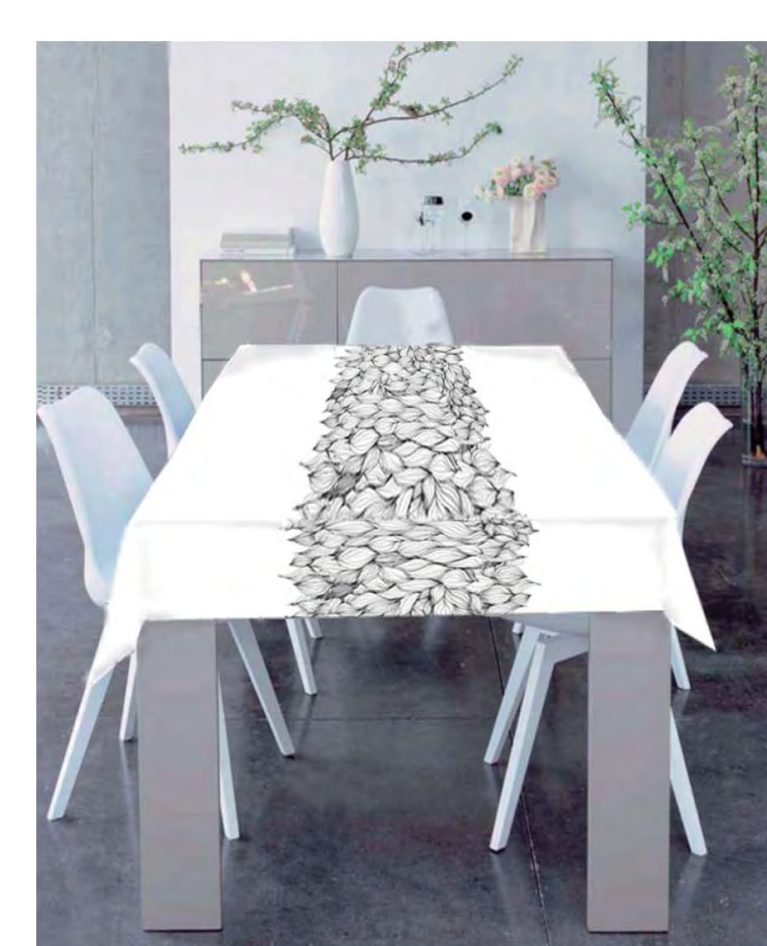
Allum Caps, linge de table Projet de Marion de Checchi présenté au concours Fly