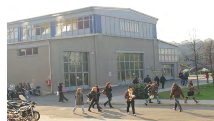
Workshop 2011 au Politecnico de Milan

Le deuxième semestre sera également l'occasion pour deux étudiantes de 2 e année, d'étudier au Politecnico de Milan. Les mobilités à Bruxelles et à Milan sont aidées financièrement par le programme européen Erasmus.