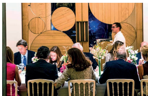
I. « Les secrets de la laque française : Le vernis Martin », Nef, 2014. II. Soirée mécènes AXA ART / Emerige à l'occasion de l'exposition « Décors à vivre : Les Arts Décoratifs accueillent AD Intérieurs 2014 », Nef, 2014.