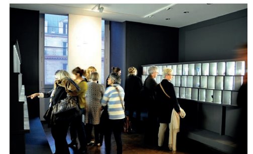
I. « Ronan et Erwan Bouroullec. Momentané », Nef, 2013. © Les Arts Décoratifs, Paris / Photo : Luc Boegly II. « Trésors de sable et de feu. Verre et cristal aux Arts Décoratifs, XIV e -XXI e siècle », Galerie d'Études, 2015. © Les Arts Décoratifs, Paris / Photo : Luc Boegly.