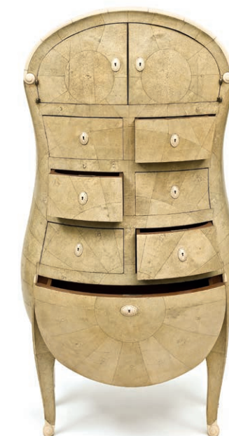
Chiffonnier Anthropomorphe, André Groult, Paris, 1925. Galuchat, hêtre, acajou, ivoire. Acquis grâce au Fonds du patrimoine, avec le concours des mécénats de Michel et Hélène David-Weill, de Jayne Wrightsman, de Shiseido, de Fabergé et de la galerie Doria, 1999.