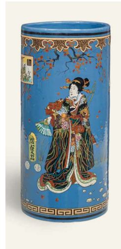
— 6. Genlis et Rudhard, Vase, Paris, vers 1863