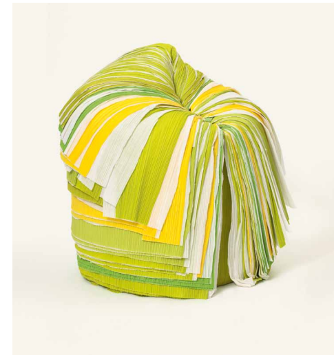
— 9. Oki Sato, Cabbage , Siège, éditions Nendo, Japon, 2008