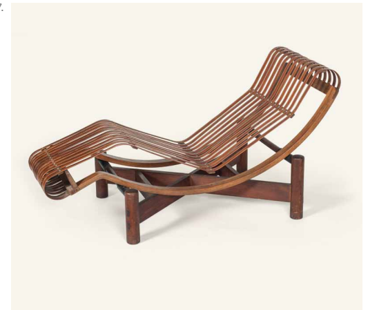
— 7. Charlotte Perriand, Chaise longue basculante , Japon, 1940