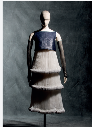
Ci-dessus à gauche : Chanel par Karl Lagerfeld, ensemble du soir, Haute couture, printemps-été 2015 @Jean Tholance, Les Arts Décoratifs, Paris, collection Mode et Textile

« Fashion Forward, 3 siècles de mode » réunit 300 pièces de mode féminine, masculine et enfantine du XVII e siècle à nos jours, issues de son fonds, assemblées, regroupées pour dessiner une frise chronologique inédite.