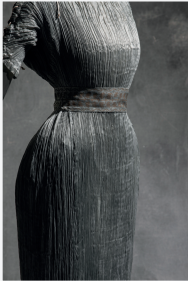
Mariano Fortuny, Robe du soir Delphos, 1910-1915