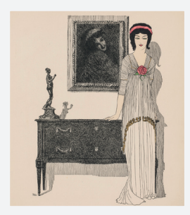
Les robes de Paul Poiret racontées par Paul Iribe, 1908, Paris, musée des Arts décoratifs

En célébrant les 30 ans de sa collection de mode, le musée des Arts décoratifs répond à une attente très forte du public : avoir enfin la possibilité d'embrasser l'histoire de la mode sur plusieurs siècles.