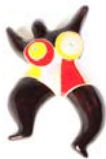
Galleries N2 Rivoli et jardins 7.3.2018 — 8.7.2018

↑ Bois gravés par Léon de Laborde pour son Glossaire français du Moyen Âge.