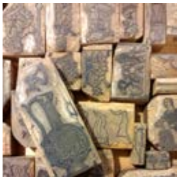
Bibliothèque 5.2.2018 — 27.4.2018