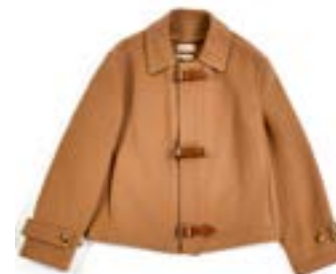
Mode et Textile 22.3.2018 — 2.9.2018