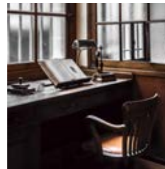
Musée Nissim de Camondo 21.9.2017 — 11.3.2018