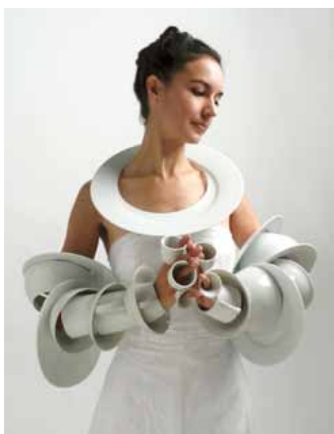
4. Marie Pendariès, installation, La Dot , 2008, porcelaine