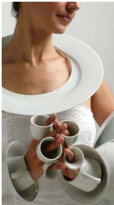
17. Ted Noten, pendentifs, Wearable gold 2 , 2000 porcelaine, or 24ct, plaqué or 18ct