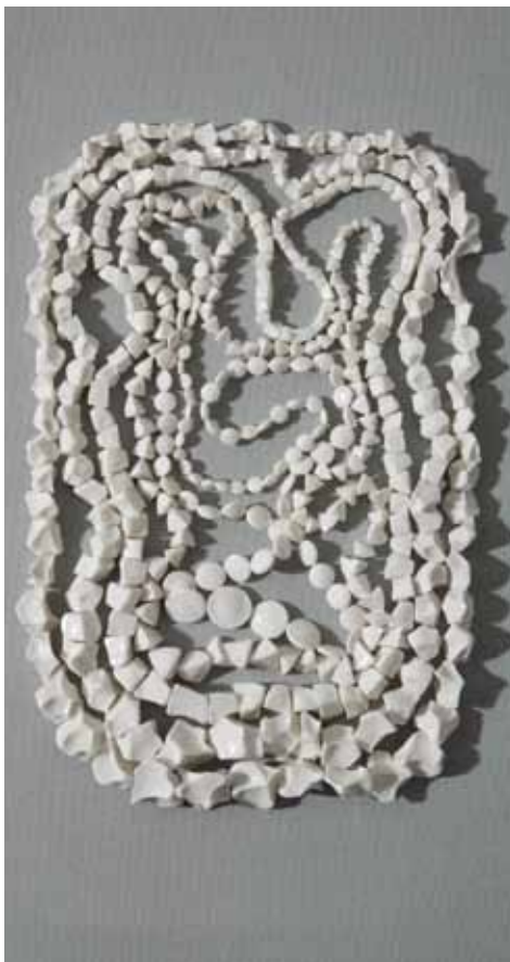
13. Rian de Jong, broche, 2007 porcelaine, cuivre © Rian de Jong

incrustée de cuivre, la créatrice raconte certes encore ses voyages, mais le chemin à parcourir semble aujourd'hui lui importer plus que l'exotisme des pays visités. La Méditerranée d'hier a fait place à des rivages encore plus lointains, mais les objets créés relatent seulement des trajectoires, s'en tiennent à circonscrire des tracés, et deviennent ainsi métaphores du sillon aventureux de la coque de son voilier. Comme autant de côtes et d'îlots sur une carte maritime imaginaire, des reliefs en cuivre sont appliqués sur des formes sinueuses en porcelaine : dans son « atelier sur les flots », Rian de Jong conçoit des bijoux plus précieux qu'auparavant, dont les techniques d'élaboration sophistiquées contrastent étonnamment avec sa situation d'éternelle marin-nomade.