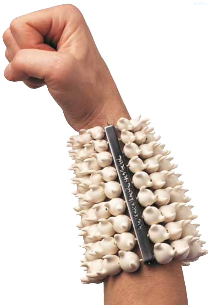
1. Peter Hoogeboom, Satanic cuff , 1996 bracelet, porcelaine, collection Helen Drutt Philadelphia (USA)

BIJOUX CONTEMPORAINS EN CÉRAMIQUE 15 MARS - 19 AOÛT 2012