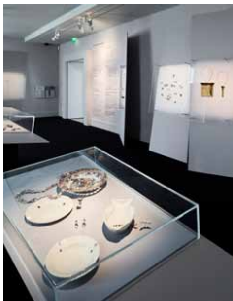
3. Vue d'exposition