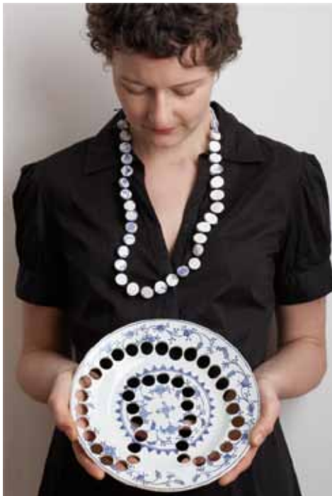
11. Gésine Hackenberg, collier et plat, Kitchen necklace + plate , 2009, faïence, fil