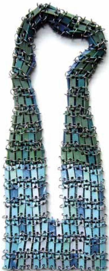
12. Peter Hoogeboom, collier de la série Unmoulded , Skellig Islands , 2007, porcelaine, acier

accidentelles, que l'homme rencontre ou provoque dans la nature. L'interaction entre les objets créés et le corps du porteur préoccupe tout particulièrement le bijoutier : ses lourds colliers de la série Unmoulded (« Non-moulé ») sont fabriqués à partir de centaines de petites plaquettes rectangulaires réunies par des anneaux en acier leur permettant d'épouser le corps avec souplesse (cf photo). The Year of Ox (« L'Année du Bœuf ») est une série récente de bijoux (broches et colliers) constitués de minuscules objets de table façonnés à la main par l'artiste lui-même, qui semblent sortir tout droit d'une maison de poupée chinoise ou d'une vitrine à bibelots : ils sont conditionnés dans des mini-vanneries reprenant la tradition exquise des emballages chinois pour les anciens transports internationaux de la porcelaine... Grâce à la persévérance et à la liberté créative exceptionnelle de Peter Hoogeboom, cette micro-vaisselle est effectivement « déplacée » de l'univers du cabinet de curiosités à celui de l'ornement corporel et de la beauté portable.