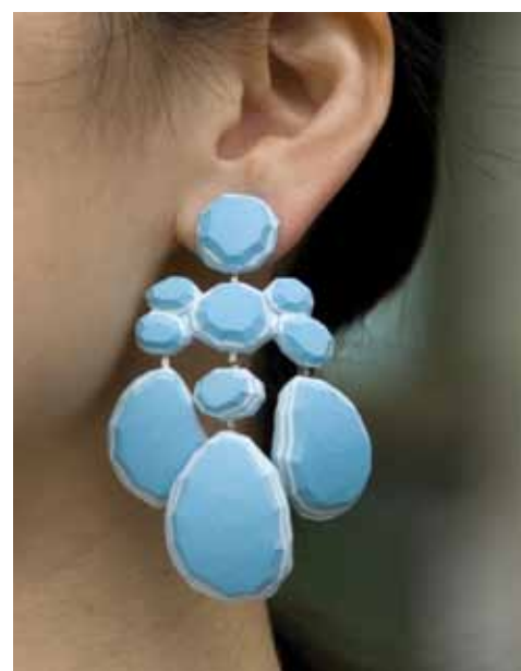
6. Shu-Lin Wu, boucle d'oreille, Girandole-Mokume # 2 , 2010, porcelaine, argent