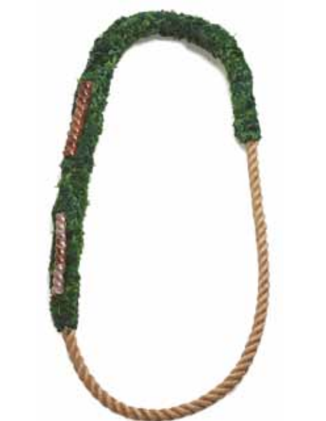
5. Willemijn de Greef, collier, Touw porcelein , textile, faïence émaillée, corde