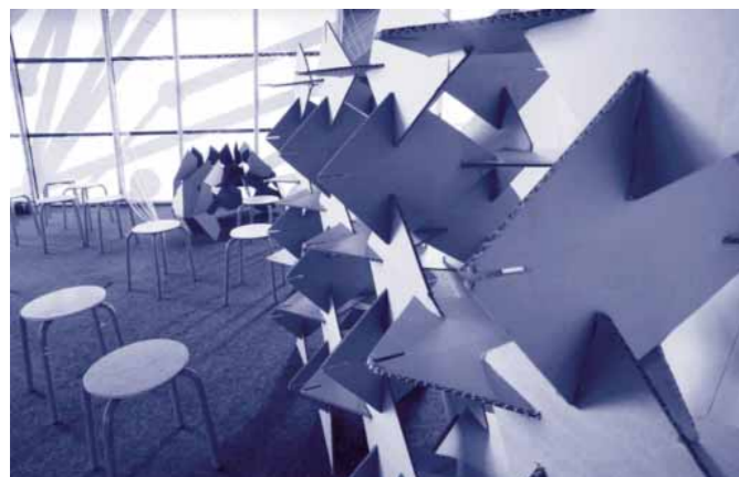
Portes ouvertes 2012, © Charlie Abad