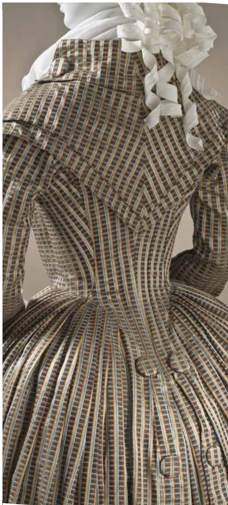
< Robe redingote, soie, coton, vers 1790

The aim of this dual approach is to provide a fuller understanding of how fashion and elegance were apprehended and created in Europe for over two centuries.