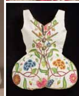
^ Corsage anglais ou de l'Inde, toile de lin brodé soie, vers 1730-1760