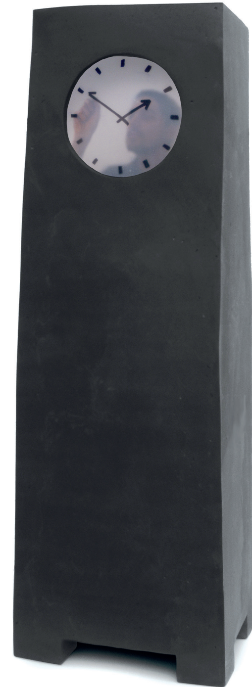
Grandfather Clock, Maarten Baas, 2009. MDF, placage de cerisier, verni, résine, vidéo. Acquis grâce au mécénat du Cercle Design 20/21, 2012. © Les Arts Décoratifs, Paris / Photo : Jean Tholance

The 17 countries now members of the TGE network: Germany, Belgium, Bulgaria, Spain, France, United Kingdom, Hungary, Slovakia, Ireland, Italy, Luxemburg, Netherlands, Poland, Portugal, Romania, Slovenia, Switzerland.