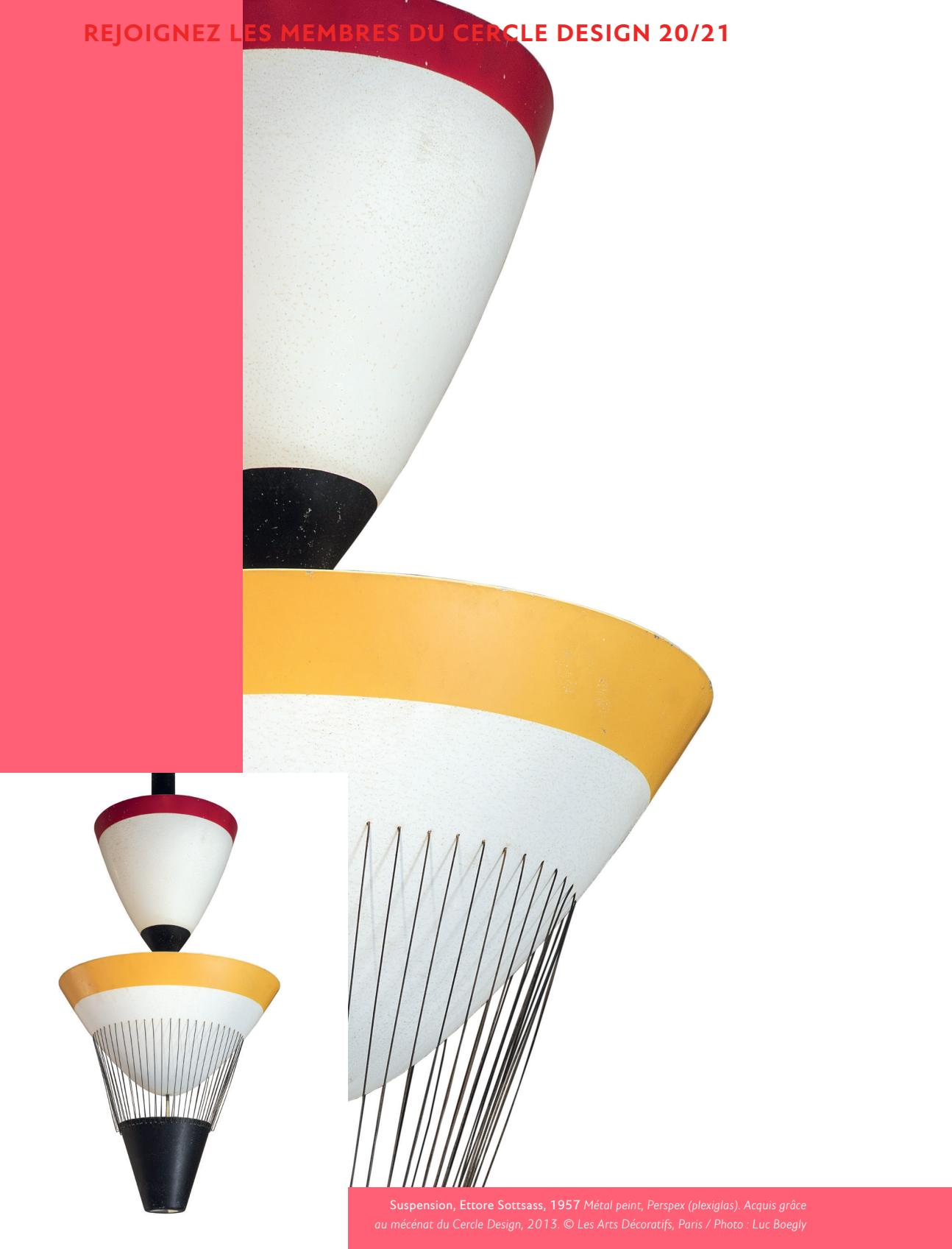
Suspension, Ettore Sottsass, 1957 Métal peint, Perspex (plexiglas). Acquis grâce au mécénat du Cercle Design, 2013.