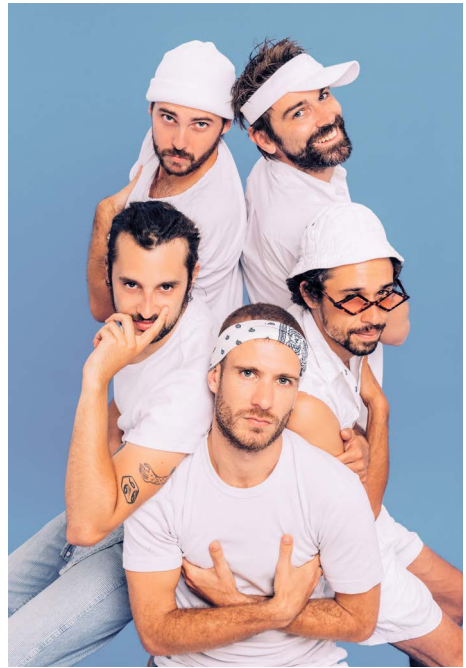
3. Pardonnez-nous