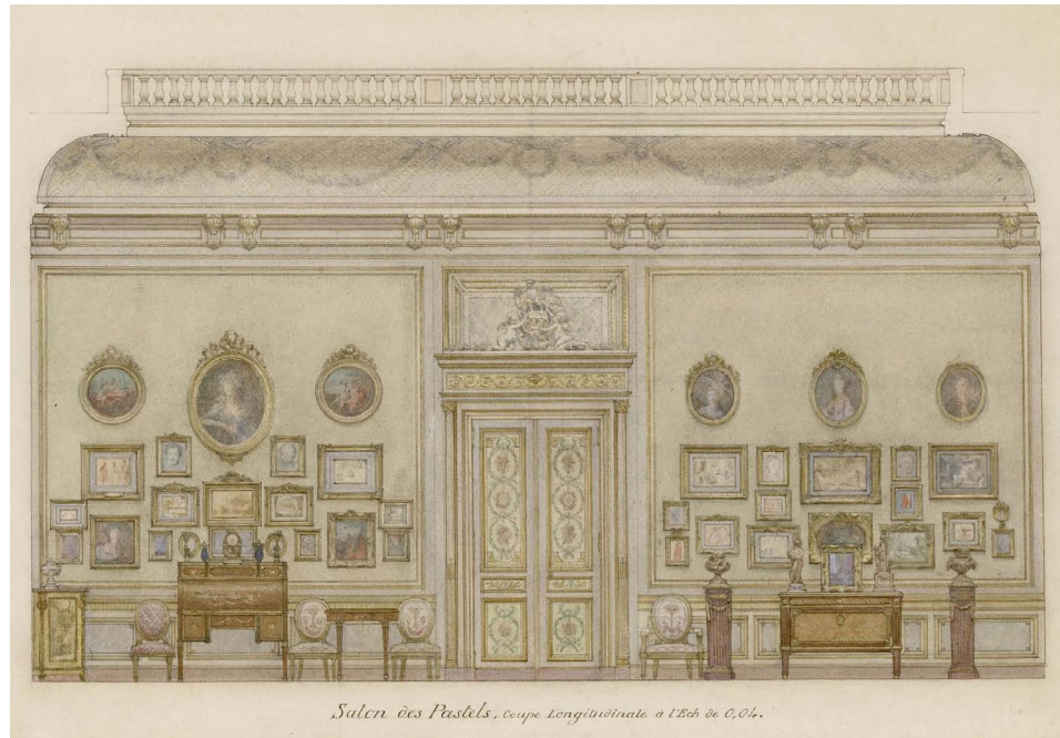
3. Adrien Karbowsky — Salon des pastels Coupe 1907 Aquarelle INHA