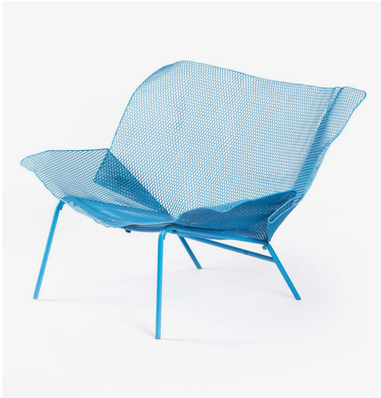
7. François Azambourg — Fauteuil Grillage 2008 Édition Cinna Tôle d'acier déployée, froissée, piètement en tube d'acier, thermolaquage polyester © Les Arts Décoratifs / Photo : Charline Croguennec / Hom project