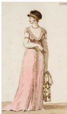
Fig. 10 Dessin de la robe de chambre, « Costume profane », n° 228, Journal des dames et des modes , 6 août 1804, sous le titre « Robe de chambre ». Paris, Bibliothèque des Arts décoratifs. Fig. 11 Robe présentée aux galeries de Boufflers et d'Assas exposée à la robe de chambre, France, sous le titre « Robe de chambre de style ancien présentée au salon de 1804 ». Paris, musée des Arts décoratifs, inv. CF n° 149.

En s'appuyant sur des sources écrites et sur de nombreuses revues illustrées, comme le Journal des dames et des modes , l'ouvrage explore les origines et les attributs de ces vêtements composites et rend compte de l'enthousiasme qui gagne l'ensemble de la société de l'époque pour l'univers pittoresque des troubadours.