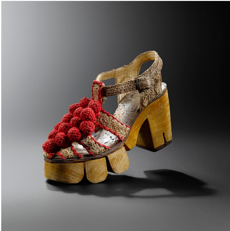
4. Sandale pour femme — Vers 1942 Paris, Musée des Arts Décoratifs