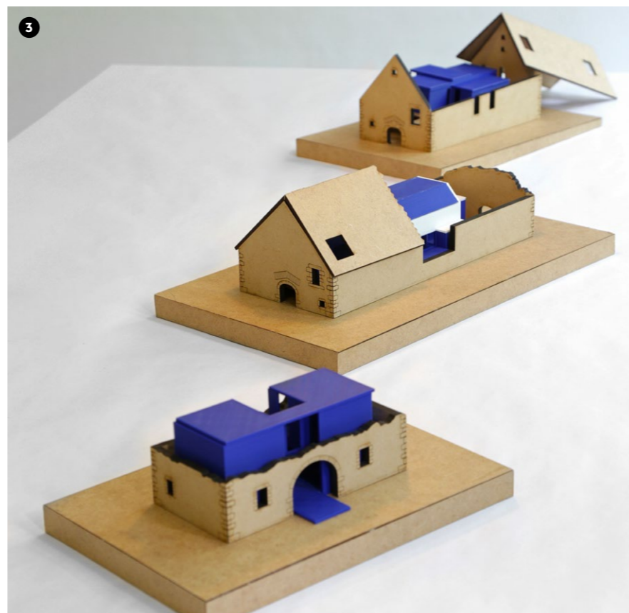
3 Habitat oublié Charline Benazech