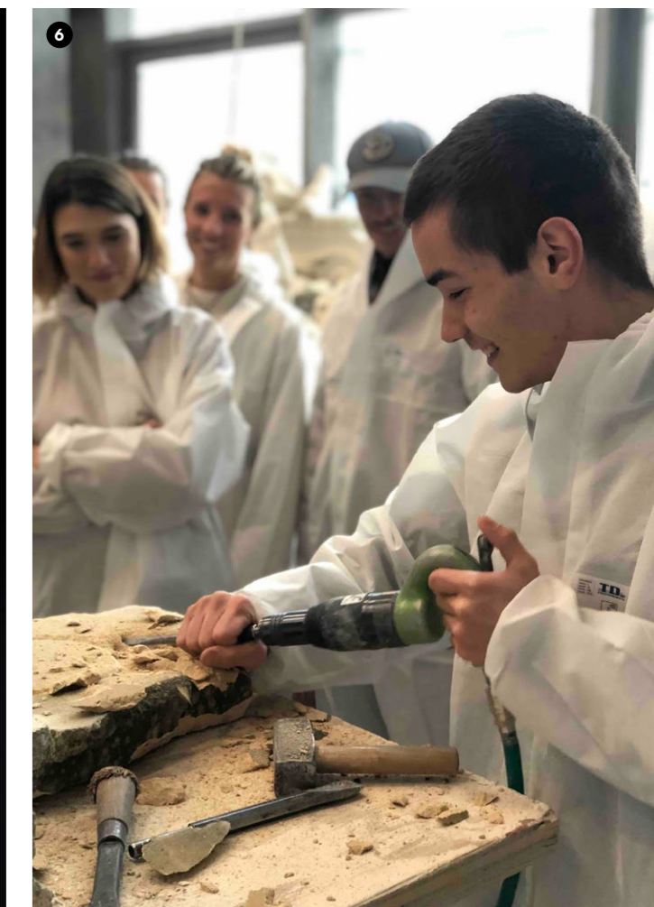
6 Atelier Campus