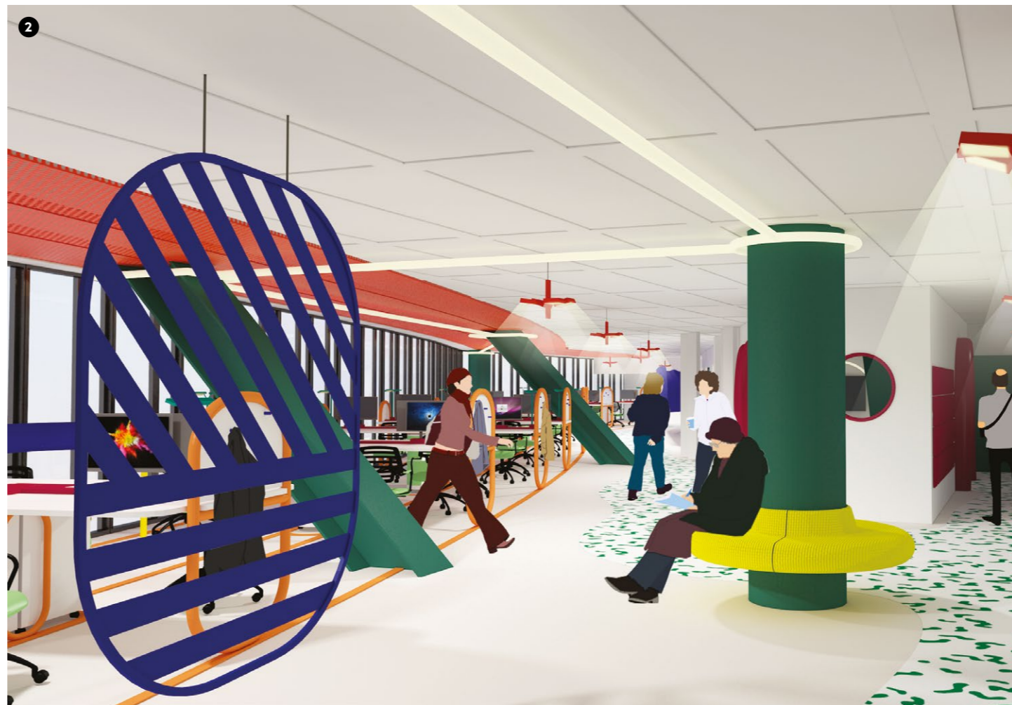
2 Espaces pour demain B. Bonnot