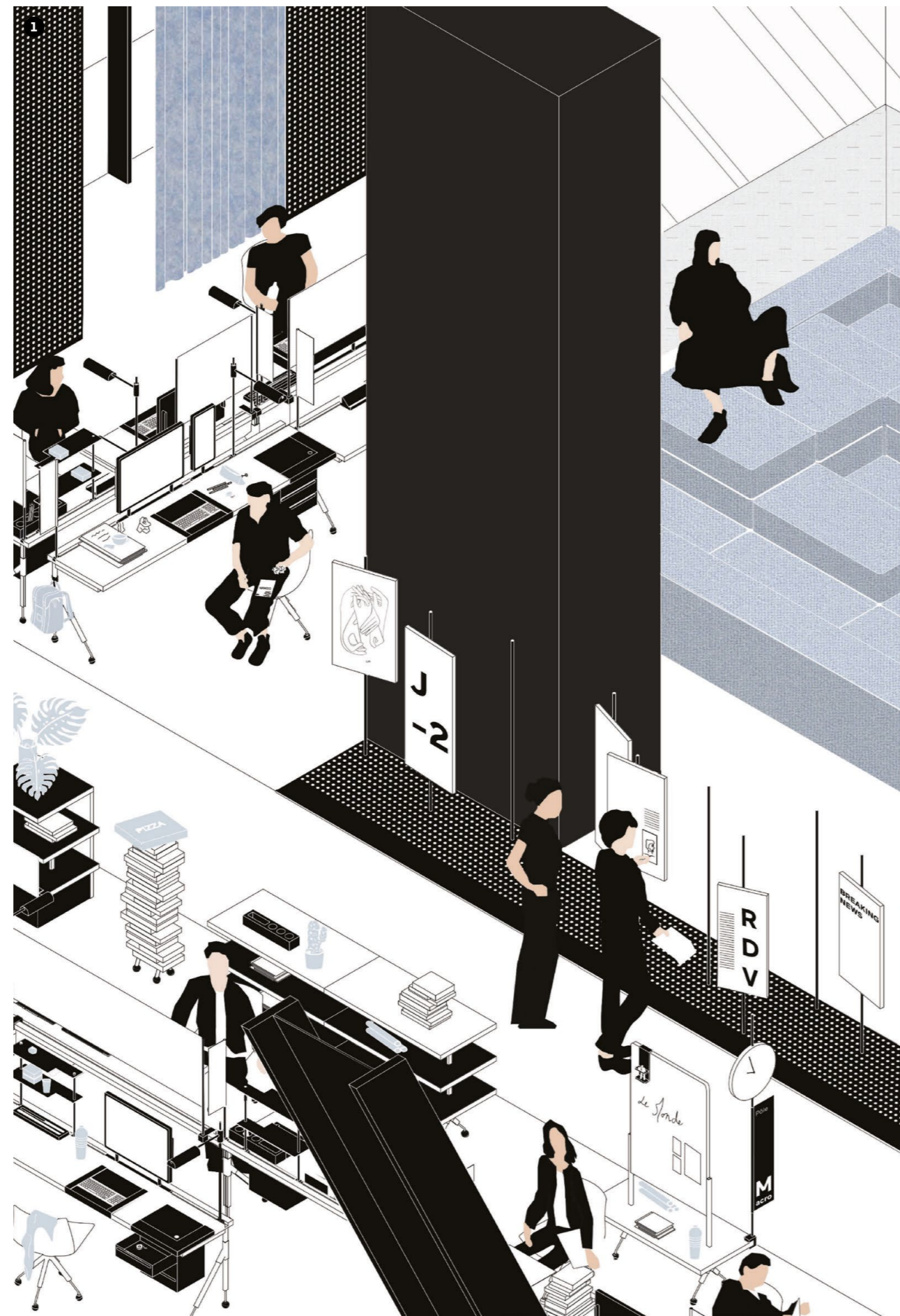
1 Espaces pour demain J. Logereau, S. Civita, C. Meneboo