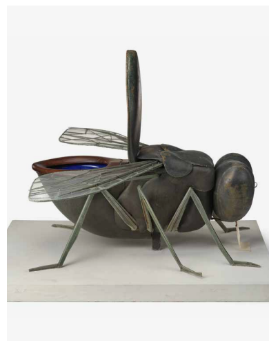
François-Xavier Lalanne — La mouche 1966-1967 Laiton, acier, porcelaine, altuglas et palissandre

Le musée des Arts décoratifs a l'honneur d'annoncer l'entrée dans ses collections de 16 œuvres majeures et 38 dessins du couple d'artistes français Claude et François-Xavier Lalanne, à l'occasion d'une dation exceptionnelle en 2021. Afin de célébrer cet événement, l'exposition « Histoires naturelles. Dation François-Xavier et Claude Lalanne au musée des Arts décoratifs » se tient dans la nef du musée, du 14 avril au 29 mai 2022. Présenté en regard d'une sélection de pièces emblématiques du musée, l'ensemble se penche sur 50 années de création, des années 1960 à 2010. Le musée des Arts décoratifs, l'une des toutes premières institutions en France à leur avoir accordé une place visible et une reconnaissance, notamment à travers la grande rétrospective « Les Lalanne » en 2010, se réjouit de leur rendre un nouvel hommage.