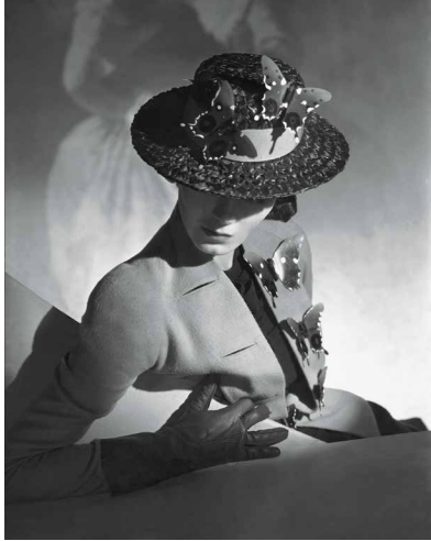
Horst P Horst — Vogue USA 15 mars 1937