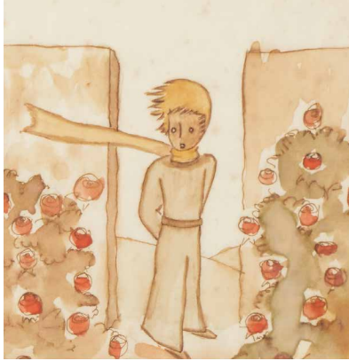
« C'était un jardin fleuri de roses » — Illustration pour le chapitre XX Probablement 1943 Aquarelle et crayon sur papier Stiftung für Kunst, Kultur und Geschichte, Winterthur © Coll. Succession Saint Exupéry-d'Agay