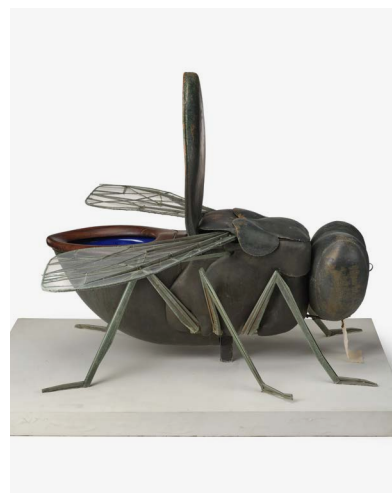
François-Xavier Lalanne — La mouche 1966-1967 Laiton, acier, porcelaine, altuglas et palissandre

Le musée des Arts décoratifs a l'honneur d'annoncer l'entrée dans ses collections de 16 œuvres majeures et 38 dessins du couple d'artistes français Claude et François-Xavier Lalanne, à l'occasion d'une dation exceptionnelle en 2021. Afin de célébrer cet événement, l'exposition « Histoires naturelles. Dation François-Xavier et Claude Lalanne au musée des Arts décoratifs » se tient dans la nef du musée, du 14 avril au 29 mai 2022. Présenté en regard d'une sélection de pièces emblématiques du musée, l'ensemble se penche sur 50 années de création, des années 1960 à 2010. Le musée des Arts décoratifs, l'une des toutes premières institutions en France à leur avoir accordé une place visible et une reconnaissance, notamment à travers la grande rétrospective « Les Lalanne » en 2010, se réjouit de leur rendre un nouvel hommage.