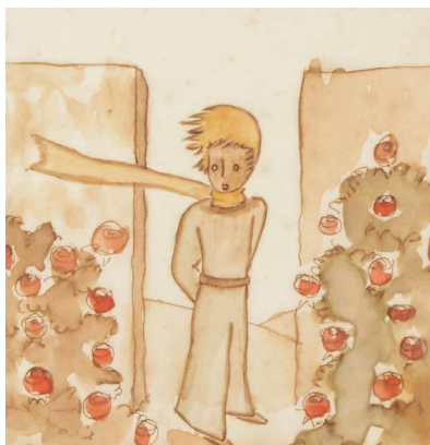
« C'était un jardin fleuri de roses » — Illustration pour le chapitre XX Probablement 1943 Aquarelle et crayon sur papier Stiftung für Kunst, Kultur und Geschichte, Winterthur © Coll. Succession Saint Exupéry-d'Agay