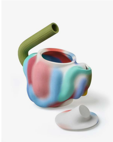
Laureline Galliot — Théière Teapot (prototype) 2017 Sculpture digitale, volumes peints, impression 3D Achat grâce au mécénat du Cercle Design 20/21, 2019 © Adagp, Paris, 2022