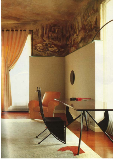
Frise de Gérard Garouste et mobilier (fauteuil club Richard III , chaise Madame , table Président M. ) de Philippe Starck pour la chambre de Danielle Mitterrand à l'Élysée — 1982