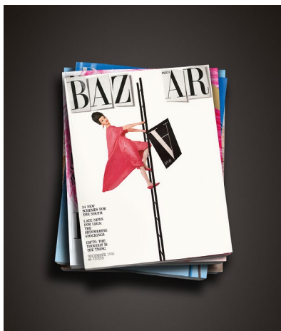
Dovima pour la couverture de Harper's Bazaar Décembre 1959