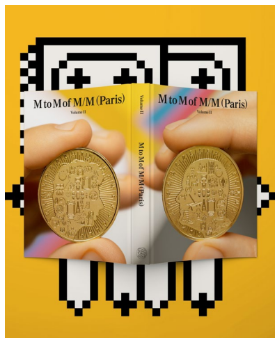
M to M of M/M (Paris), Volume 2 édition Thames & Hudson © Thames & Hudson