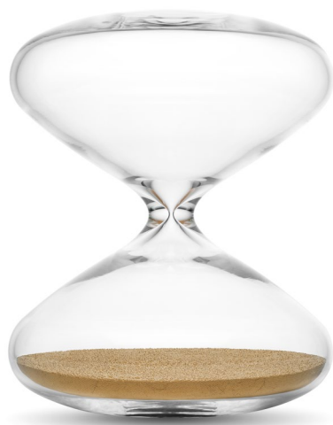
The Hourglass — Marc Newson, Suisse, 2015 Verre borosilicate, nanobilles en acier inoxydable plaquées or © Philippe Joner