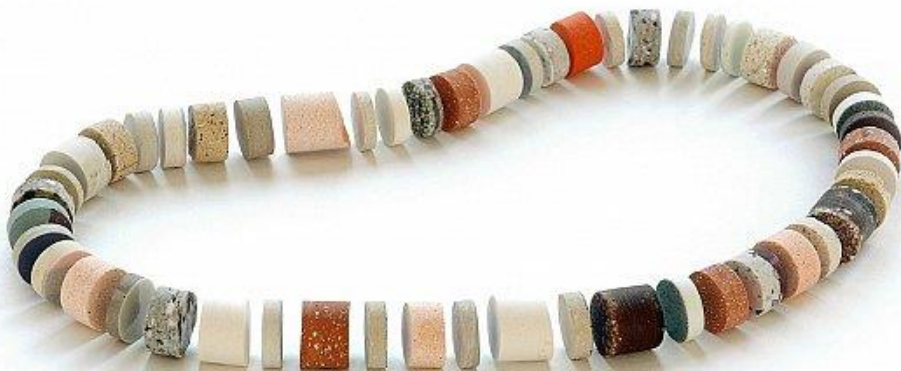
Julie Decubber, Installation Farandole , 2020