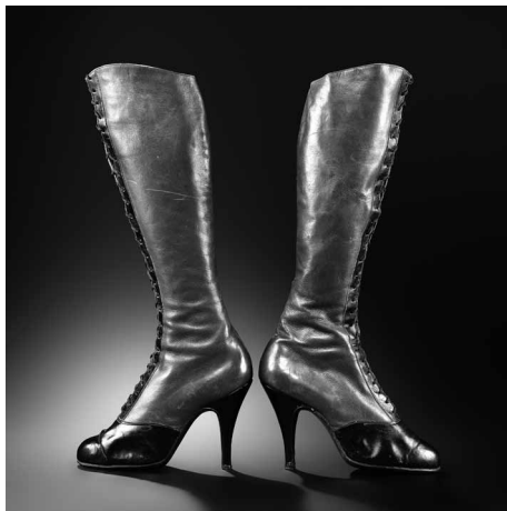
Marche et démarche. Une histoire de la chaussure 7 novembre 2019 → 22 mars 2020

Le Musée des Arts Décoratifs, en partenariat avec la chancellerie des universités de Paris, consacre une exposition à la marquise Arconati Visconti (1840-1923), figure de proue du mécénat envers les musées et les établissements d'enseignement en France. « Marquise Arconati Visconti. Femme libre et mécène d'exception » retrace la destinée exceptionnelle de celle qui a hérité d'une des plus grandes fortunes italiennes et qui a légué des œuvres de première importance ; peintures, sculptures, mobilier, objets d'art, mais aussi bijoux et céramiques, aux musées français et en particulier au Musée des Arts Décoratifs. C'est au total une centaine d'œuvres, issues de dons successifs, accompagnés de documents d'archives, que déploie le musée dans ses collections permanentes témoignant de la passion immodérée de la marquise pour les arts décoratifs, du Moyen Âge, de la Renaissance, des XVIII e et XIX e siècles, et de son intérêt pour les arts asiatiques et islamiques. Ce prestigieux patrimoine qu'elle a constitué puis légué illustre ses engagements, aussi bien dans le domaine des arts et des lettres qu'en politique.