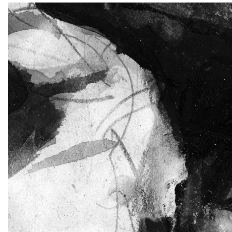
Le dessin sans réserve. Collections du Musée des Arts Décoratifs 26 mars → 19 juillet 2020

À l'occasion de la réouverture des galeries de la mode, entièrement rénovées grâce au mécénat de Stephen et Christine Schwarzman, le Musée des Arts Décoratifs présente une grande exposition consacrée au célèbre magazine de mode américain Harper's Bazaar . Soixante créations de couture et de prêt-à-porter, issues essentiellement des collections du musée, ponctuées de prêts de pièces iconiques prestigieuses sont présentées en correspondance avec leur parution dans ce magazine. Le regard des grands photographes et illustrateurs qui ont fait le renom de Bazaar est ainsi mis en perspective pour résumer un siècle et demi d'histoire de mode. Man Ray, Salvador Dalí, Richard Avedon, Andy Warhol, ou encore Peter Lindbergh ont, en effet, contribué à l'esthétique hors pair du magazine. « Harper's Bazaar, premier magazine de mode » retrace les moments forts de cette revue mythique, son évolution depuis 1867, en rendant hommage aux personnalités qui l'ont façonnée : Carmel Snow, Alexey Brodovitch et Diana Vreeland. Tous trois, à partir des années trente propulsent le magazine dans la modernité de la mode et du graphisme instaurant une exigence qui fait encore école.