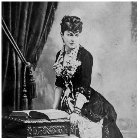
Marquise Arconati Visconti. Femme libre et mécène d'exception 13 décembre 2019 → 15 mars 2020

Le Musée des Arts Décoratifs, en partenariat avec la chancellerie des universités de Paris, consacre une exposition à la marquise Arconati Visconti (1840-1923), figure de proue du mécénat envers les musées et les établissements d'enseignement en France. « Marquise Arconati Visconti. Femme libre et mécène d'exception » retrace la destinée exceptionnelle de celle qui a hérité d'une des plus grandes fortunes italiennes et qui a légué des œuvres de première importance ; peintures, sculptures, mobilier, objets d'art, mais aussi bijoux et céramiques, aux musées français et en particulier au Musée des Arts Décoratifs. C'est au total une centaine d'œuvres, issues de dons successifs, accompagnés de documents d'archives, que déploie le musée dans ses collections permanentes témoignant de la passion immodérée de la marquise pour les arts décoratifs, du Moyen Âge, de la Renaissance, des XVIII e et XIX e siècles, et de son intérêt pour les arts asiatiques et islamiques. Ce prestigieux patrimoine qu'elle a constitué puis légué illustre ses engagements, aussi bien dans le domaine des arts et des lettres qu'en politique.