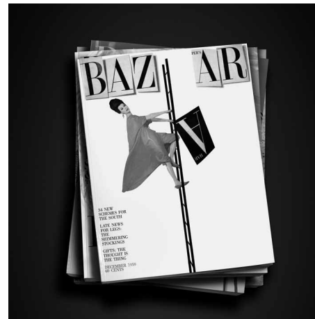
Harper's Bazaar, premier magazine de mode 28 février → 14 juillet 2020

Après « La Mécanique des dessous » (2013) et « Tenue correcte exigée ! » (2017), le Musée des Arts Décoratifs poursuit l'exploration du rapport entre le corps et la mode avec un troisième volet aussi surprenant qu'original autour de la chaussure, la marche et la démarche. L'exposition « Marche et démarche. Une histoire de la chaussure » s'interroge sur le statut de cet accessoire indispensable du quotidien en visitant les différentes façons de marcher, du Moyen Âge à nos jours, tant en Occident que dans les cultures non européennes. Comment femmes, hommes et enfants marchent-ils à travers le temps, les cultures et les groupes sociaux ? Près de 500 œuvres : chaussures, peintures, photographies, objets d'art, films et publicités, issues de collections publiques et privées françaises et étrangères, proposent une lecture insolite d'une pièce vestimentaire parfois anodine souvent extraordinaire.