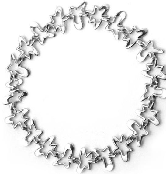
> collier, argent Henning Koppel (Copenhague, 1918-1981)

Georg Jensen est né en 1866. Après une formation de sculpteur et d'orfèvre, il ouvre son premier atelier à Copenhague en 1904. Inspirés par l'Art Nouveau, ses bijoux développent pourtant un style très personnel, qui a beaucoup influencé la production de bijoux en argent pendant la première moitié du xx e siècle. A sa mort en 1935, il était reconnu comme l'un des meilleurs orfèvres de son temps. Après la guerre, l'atelier de Georg Jensen a mis au point une véritable politique de création concertée avec des architectes et des sculpteurs, reconnus. Ainsi, à partir de 1945, la société Jensen s'assure la collaboration du designer danois Henning Köppel, qui crée d'abord des modèles de bijoux, puis d'orfèvrerie.